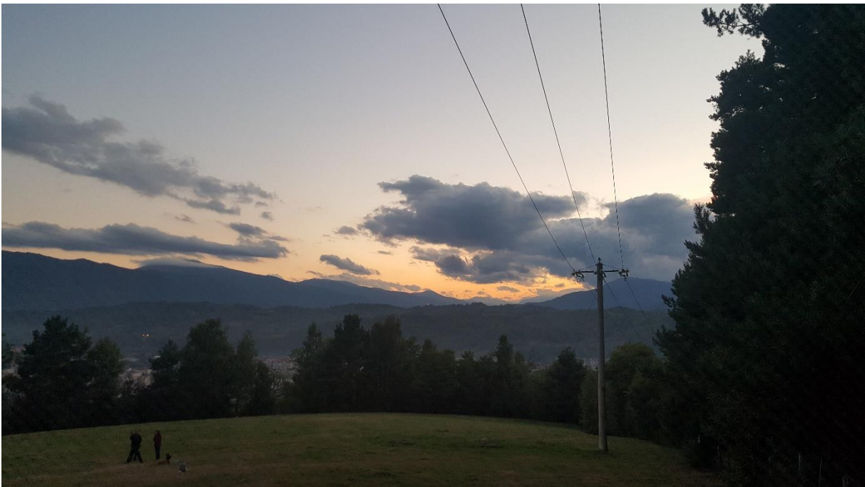
Blick vom Stadtberg Brâdet auf Petroșani. Hier verbringen viele Jugendliche ihre Sommerabende.