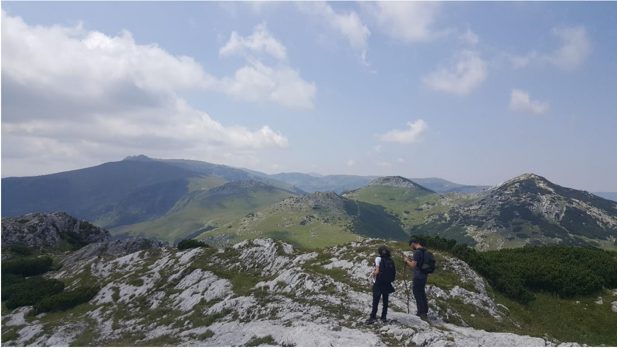
Wanderung mit Freunden im Nationalpark Retezat